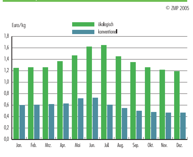
Abb. 2: Verbraucherpreise für Kartoffeln in Deutschland 2004